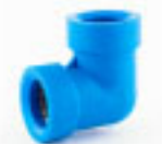
1 Codo Blu Lock 1/2"