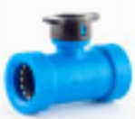
1 Tee Blu Lock 3/4 x 1/2"