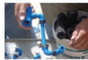
1- Conjunto de ensamble