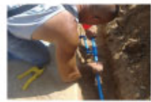
3- Inserte la línea lateral en el ensamble