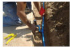
4- Conecte el aspersor al ensamble