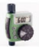
1 Programador automático a pila 1 estación