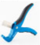
1 Cortador de manguera Blu lock