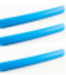
Manguera 3/4" (3 cortes de 10cm)