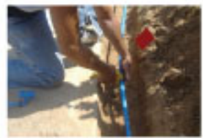
2- Corte en la línea lateral