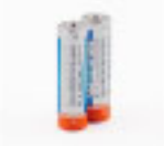
2 Pilas AA