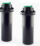
2 Aspersores Pop-up Saturno III